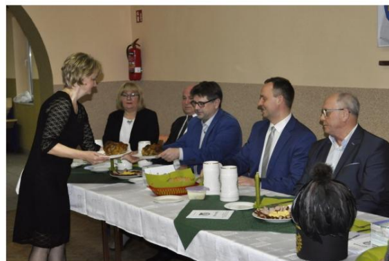
Barbórkowa „Karczma Pivna” w Brzezince.