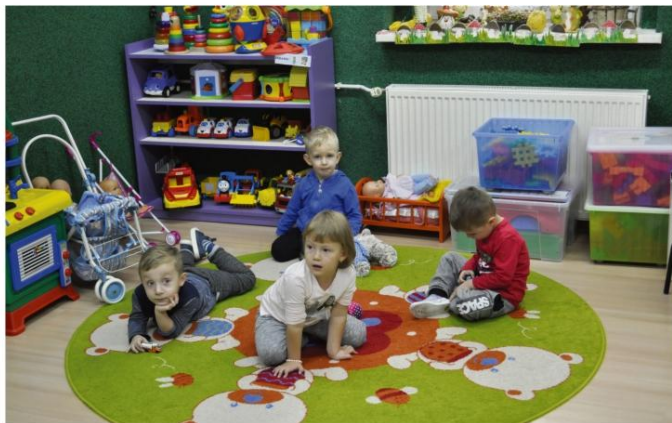
Pracownicy i przyjaciele przedszkola w Zaborzu doposażyli je i wyremontowali sale z pomocą FROPSSiK-a.

Fundacja Rozwoju Oświaty Polityki Społecznej Sportu i Kultury pomaga gminnym przedszkolom i szkołom, stowarzyszeniom i grupom nieformalnym od jesieni 2015 roku. W tym czasie instytucje działające na terenie gminy Oświęcim przeznaczyły na swoje potrzeby około 100 tys. złotych zdobyte z pomocą FROPSSiK-a.