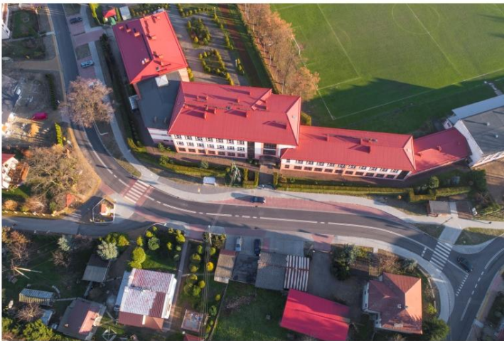
Przebudowa dróg powiatowych w Zaborzu pochłonęła ponad 3,5 miliona złotych.

Na terenie gminy Oświęcim w tym roku zostaną zrealizowane inwestycje za ponad 16 milionów złotych. To największe nakłady w ostatnich sześciu latach. Od początku obecnej kadencji władze Gminy porządkowały finanse samorządu. Równocześnie urzędnicy znajdowali pieniądze na realizację kluczowych przedsięwzięć poza gminnym budżetem. Od wiosny trwa inwestycyjny boom.